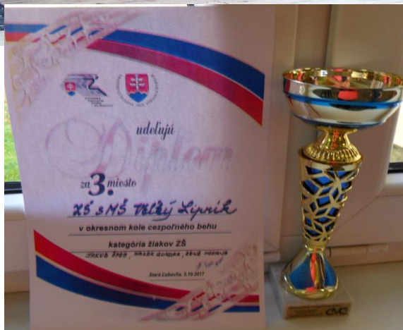
Tomáš Gvozdík 7. ročník