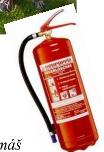
Tomáš Gvozdiak 7. ročník