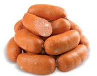
Tomáš Kalna 8. ročník