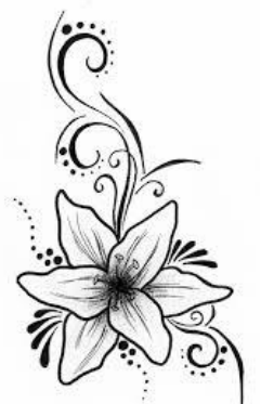
Frederika Zajacová 8. ročník