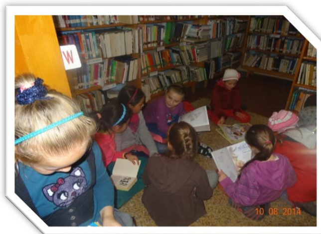
Frederika Zajacová 8. ročník